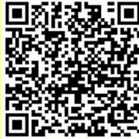
แบบถามตอบแลกเปลี่ยนเรียนรู้